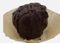
チョコボール (洋酒なし)