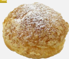
ビスケットシュー