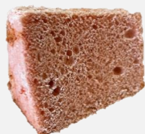
いちごのシフォンケーキ