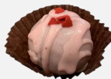
いちごチョコボール (洋酒なし)