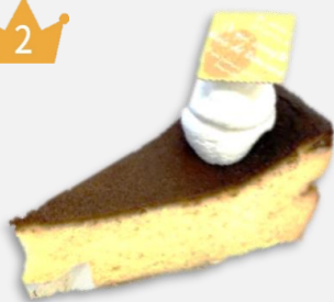
ベイクドチーズケーキ