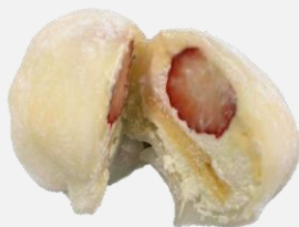
フルーツ大福(いちご)