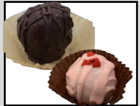
チョコボール(苺・チョコ) ¥100〜