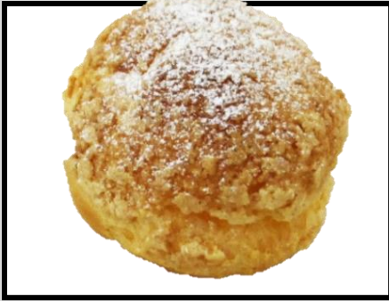
ビスケットシュー ¥200