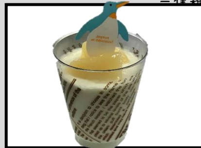
パンナコッタ ¥250 夏季限定! さわやかで食べやすい商品です