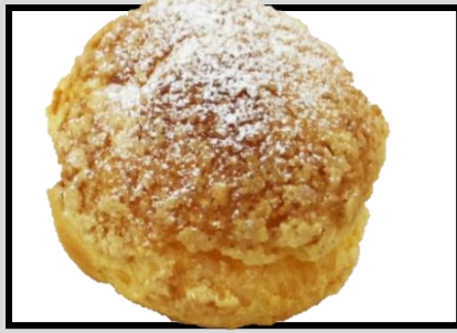
ビスケットシュー ¥200 皮はサク!クリームとろ〜り 一番人気商品です★