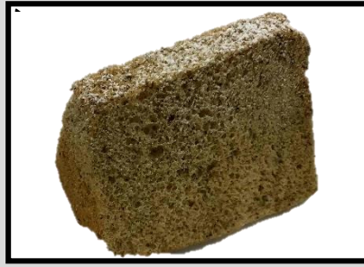
紅茶シフォンケーキ ¥200 ふわふわしっとり食感