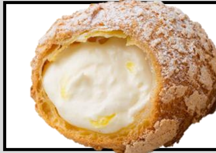
檸檬シュー ¥250 限定商品