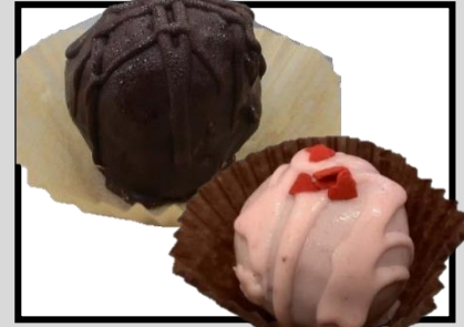
チョコボール(苺・チョコ) ¥100〜 みんな大好きチョコボール! 二種類の商品展開です。