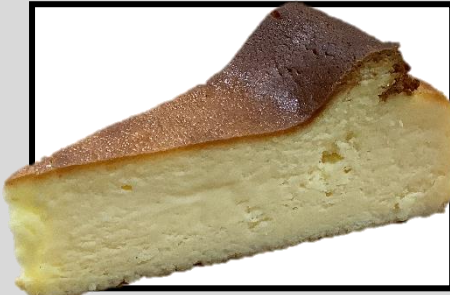
ベイクドケーキ ¥300 濃厚なチーズが 口の中で社交ダンスします。