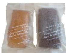
フィナンシェ 各1個 100円