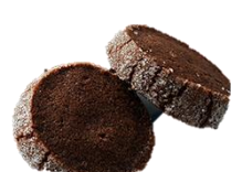
ダイヤモンドショコラ