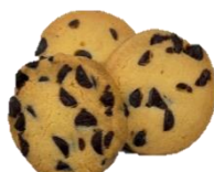
チョコチップクッキー